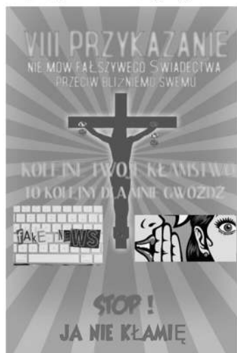
Praca Oskara Kaczmarka

https://padlet.com/agatajankowiak92/hwv62fk0f54voav1