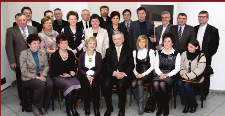
Pamiątkowe zdjęcia z kolejnych jubileuszy „Więści Pępowa”