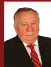
Wójt Stanisław Krywicki (po raz pierwszy wybrany w wyborach powszechnych)